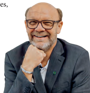
Gerhard Fügl Bürgermeister