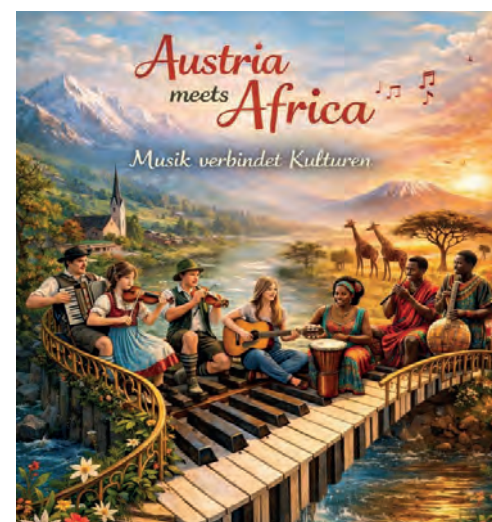
Gestaltet wurde das Bild mit Unterstützung der KI von den Schülerinnen und Schülern der Polytechnischen Schule.

Die Kunstwerke können gegen eine freiwillige Spende erworben werden.